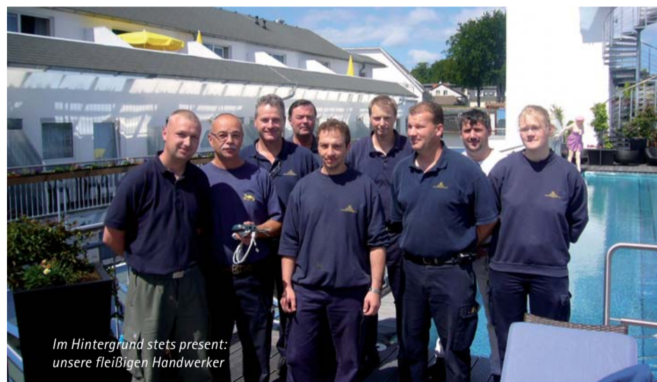
Im Hintergrund stets present: unsere fleißigen Handwerker