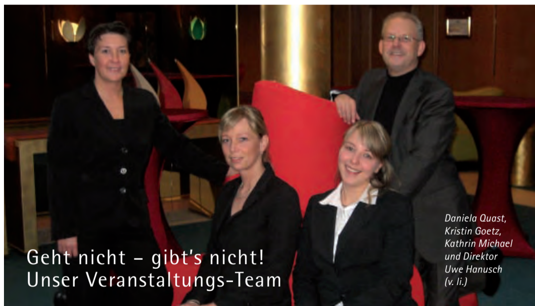
Geht nicht – gibt's nicht! Unser Veranstaltungs-Team